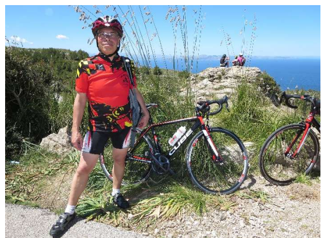
Mallorca påsken 2014