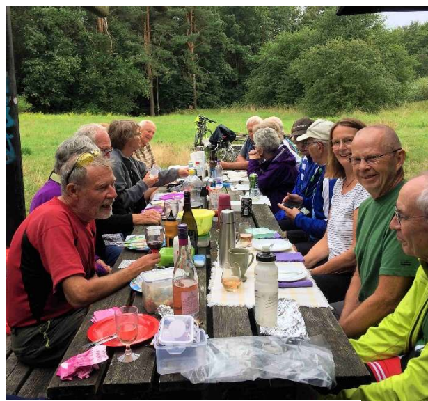
Grillmøde i Vestskoven 2019