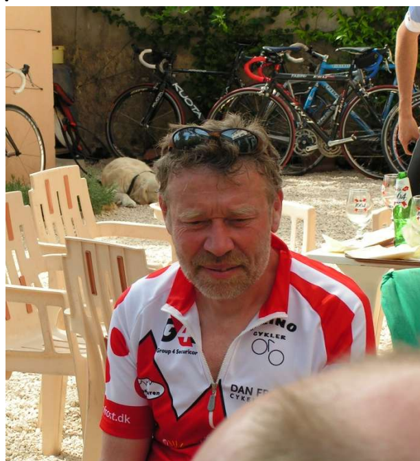
Fra påsketur til Provence i 2007