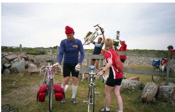
Tur til Margrethetorp 1987

Jeg husker med stor glæde de mange sommerferieture til Frankrig, samt bl.a. Italien og Ungarn. Først sent begyndte jeg at køre med i træningsturene om onsdagen og om søndagen i vintersæsonen. I dag er det nok træningsturene, som jeg mest deltager i.