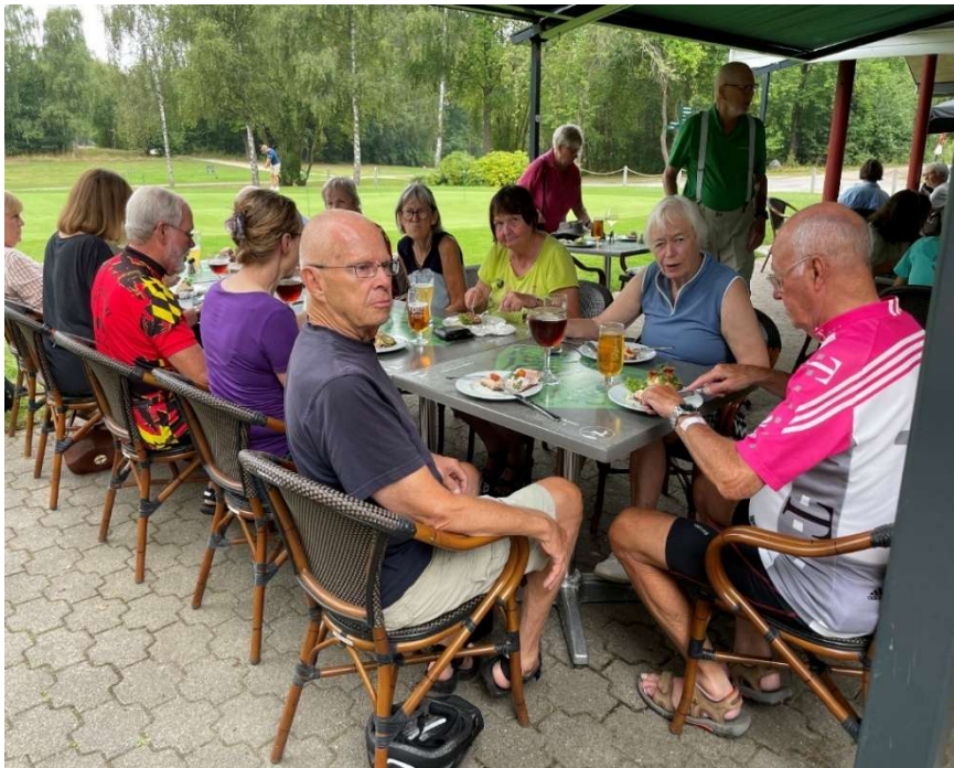
Klubhistorie: Klubfrokosterne er meget populære. Her frokosten i august 2023