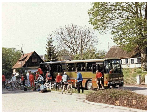
Fra tur til Bromølle i 1986