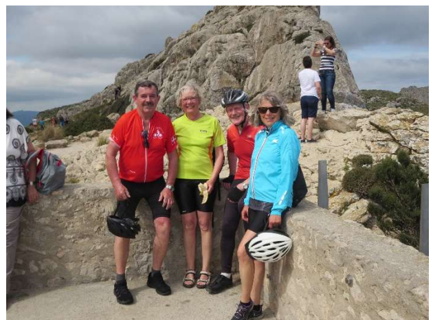
På vej til Cap Formentor på Mallorca i 2019

Det kunne ikke fortsætte. I foråret 2013 så jeg en annonce fra Dansk Cyklistforbund. De arrangerede cykeltur langs Mølleåen. Jeg mødte op og her traf jeg