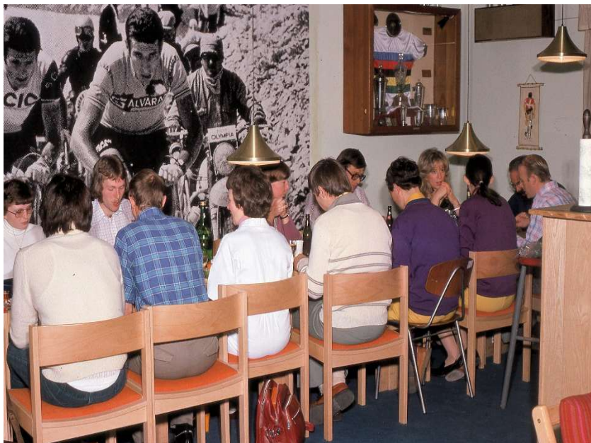
Klubmøde 1976 med spisning i lokalerne i Avedøre