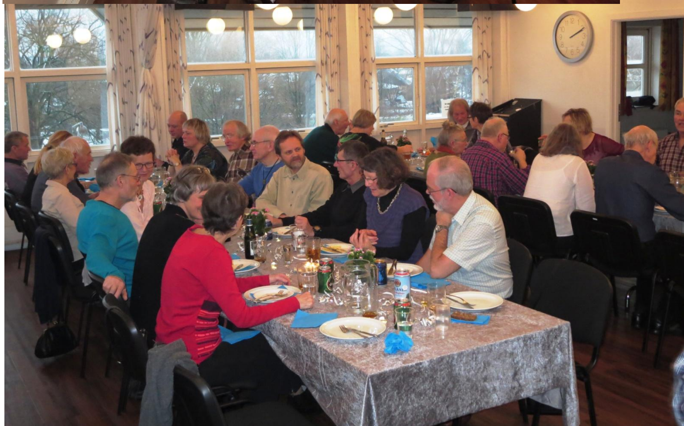
Nytårsfrokost i hyggelige omgivelser.