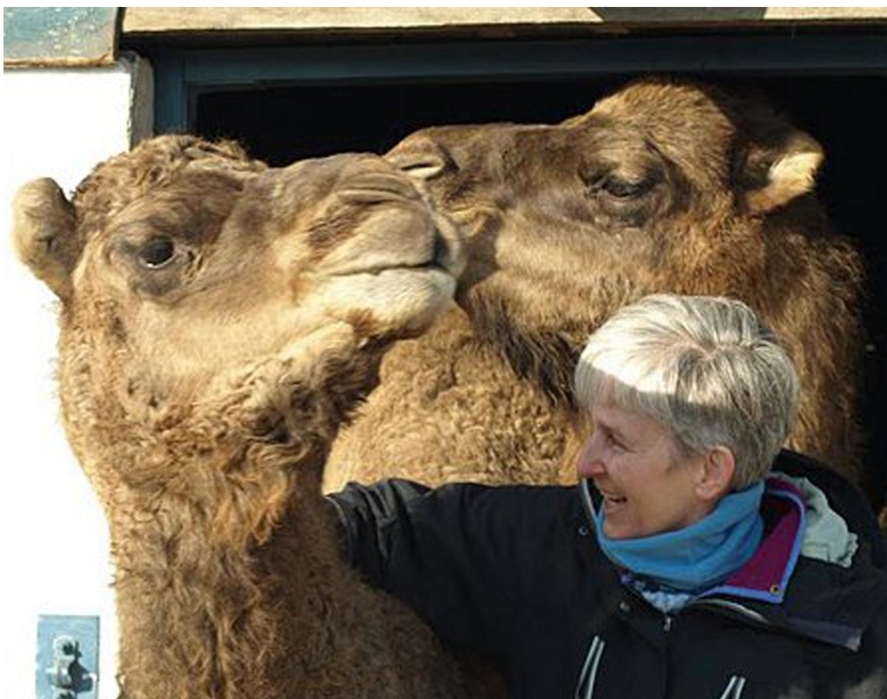
24. maj kan disse herlige dyr beses.