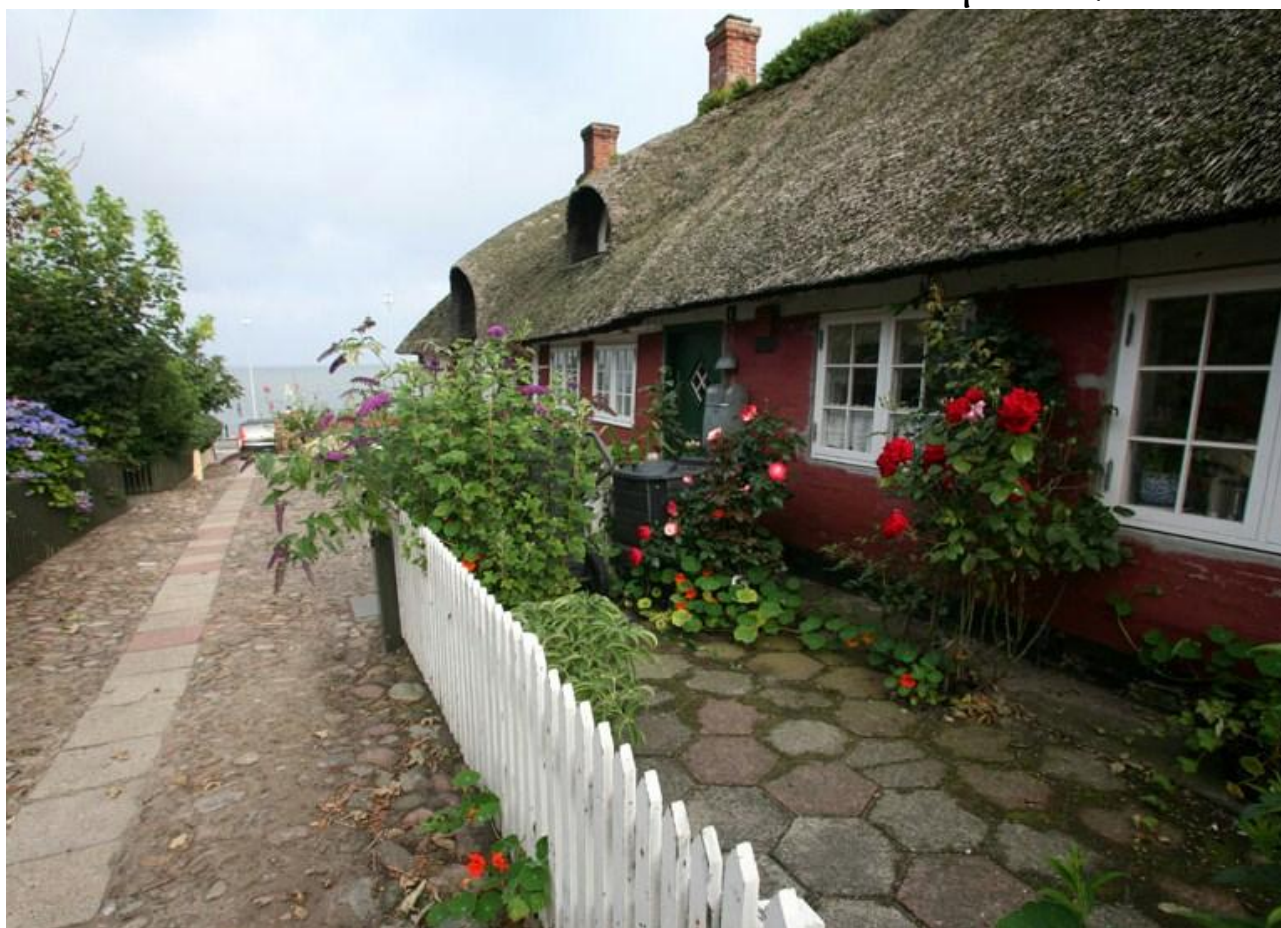
Hus på Fanø