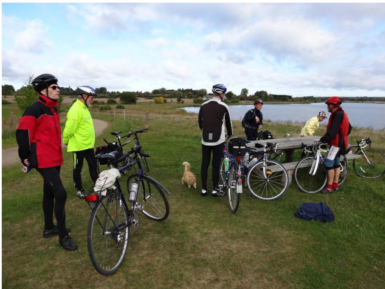
Dejlig udsigt over Solbjerg Eng sø