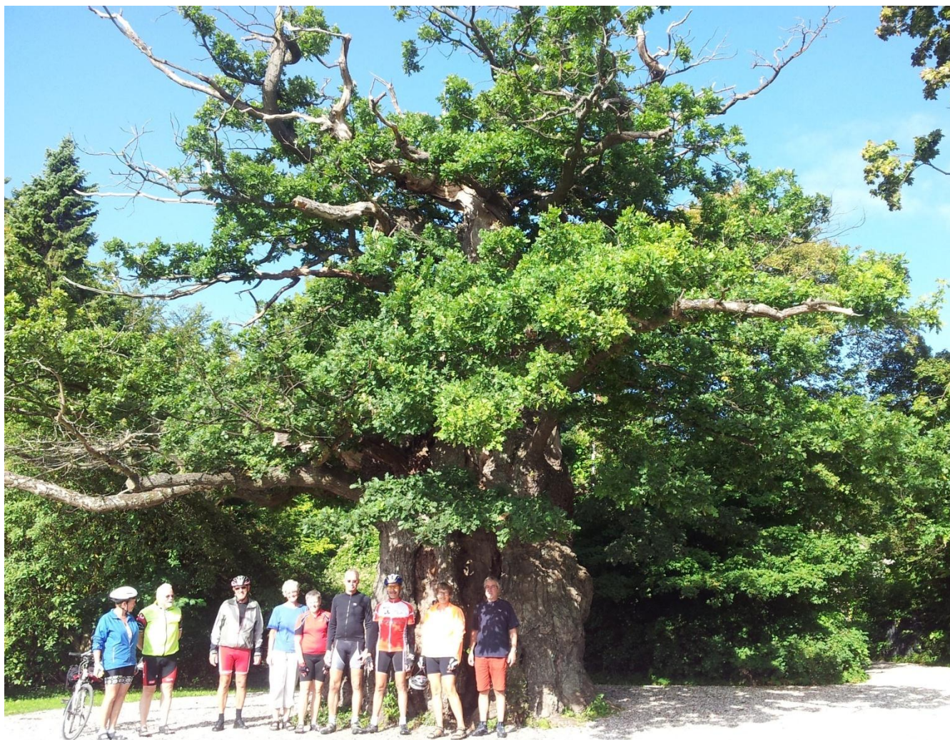
Læg mærke til det meget gamle egetræ