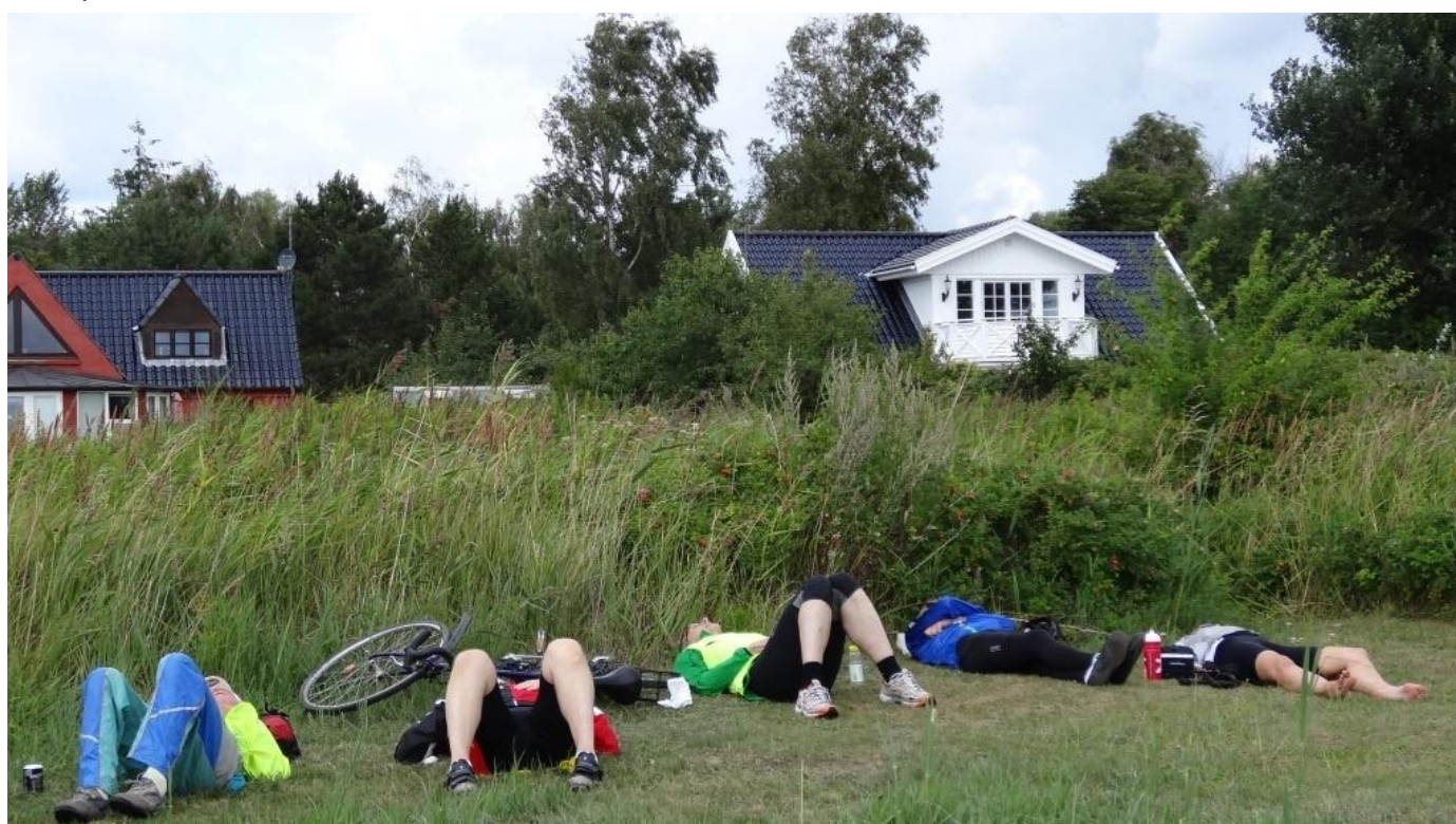
Skønt med et hvil