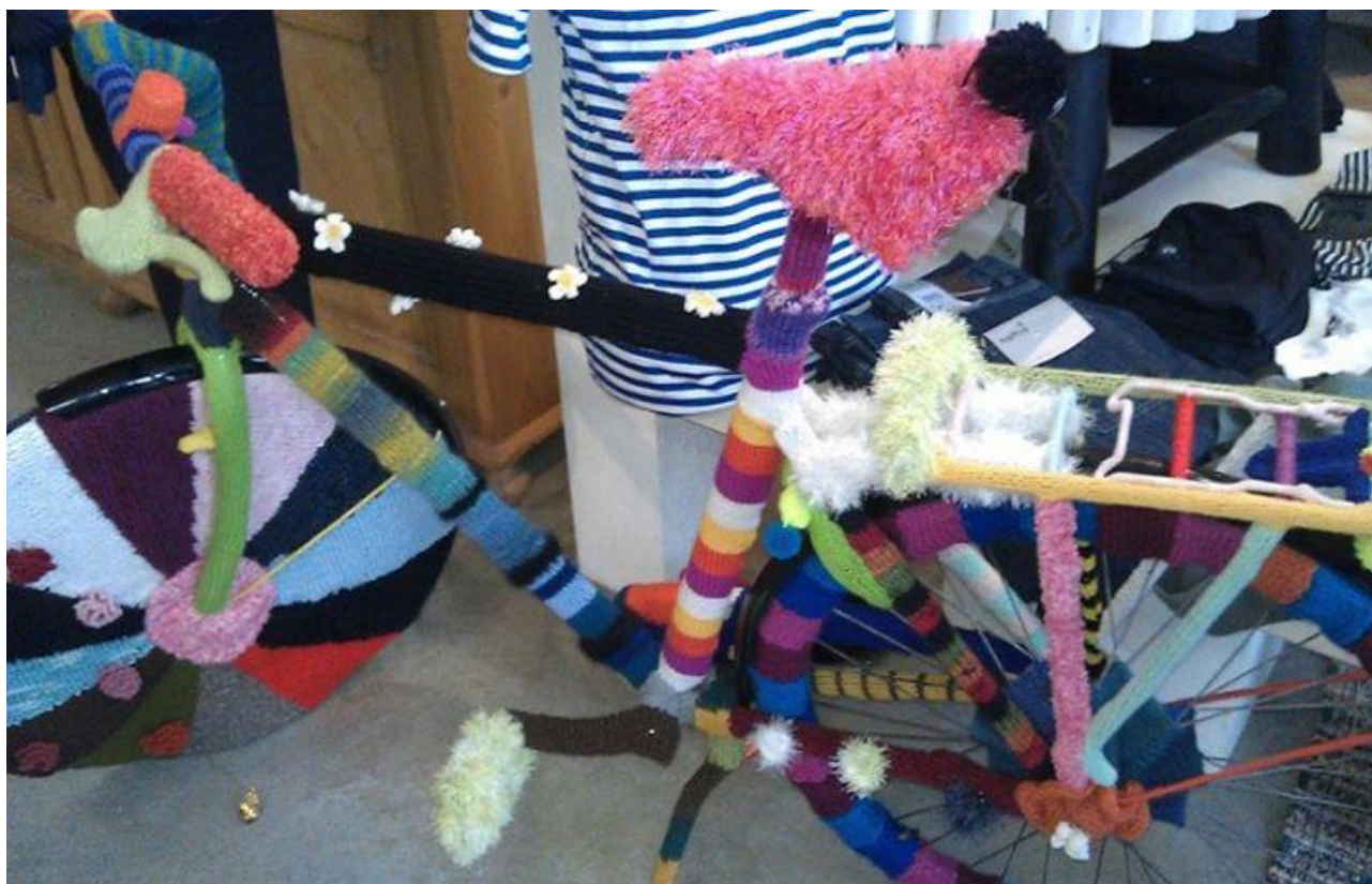
Vintercykel ?? Set på Fanø