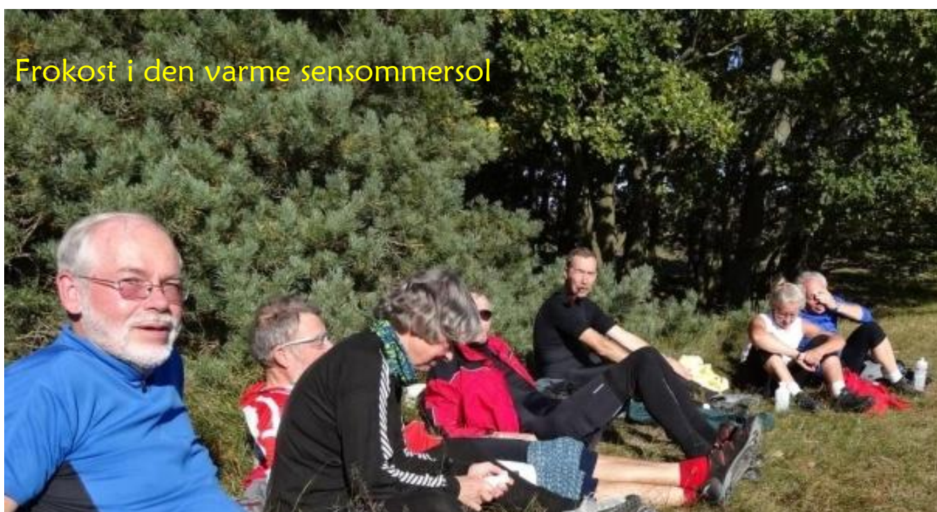
Frokost i den varme sensommersol