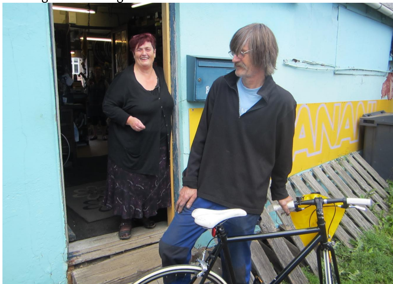
Tulle og Lillebror bag butikken