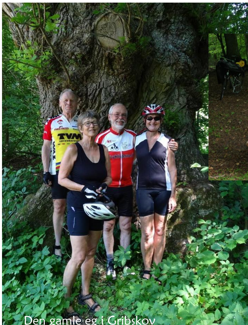
Den gamle eg i Gribskov