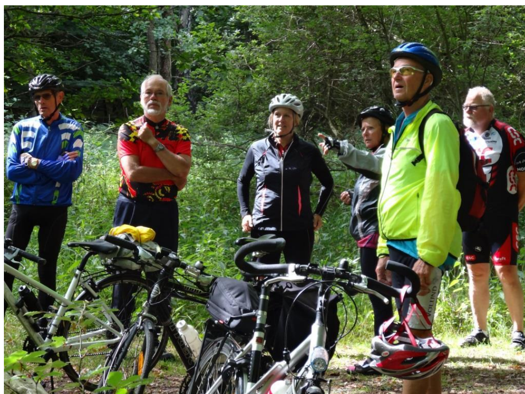
Turen til Lynæs