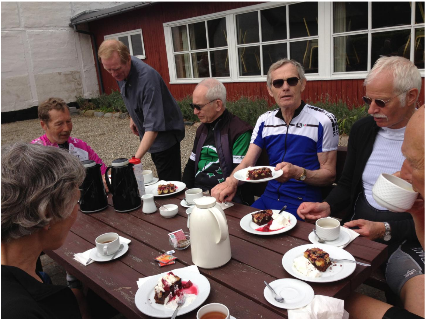
Kaffebord ved Højerup Kirke.