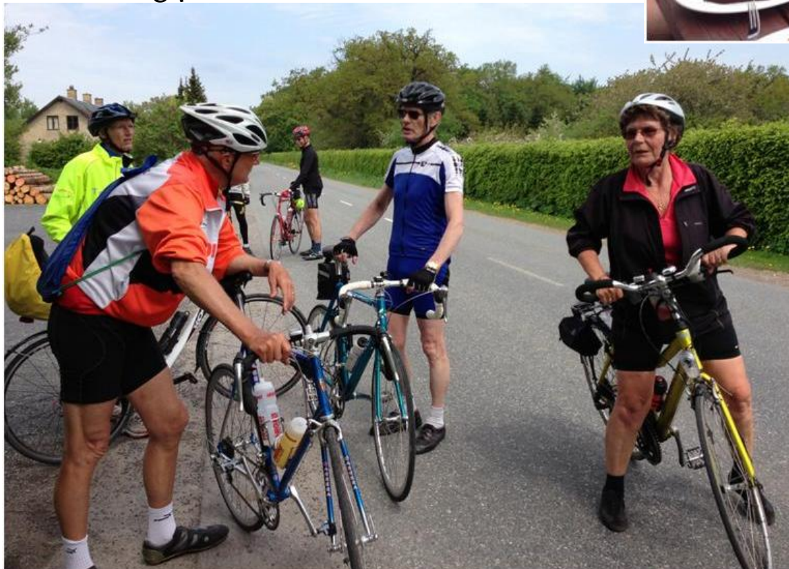
Uhm lækkert !!