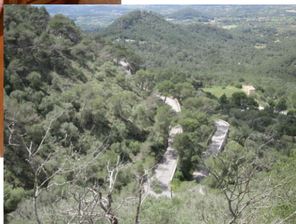
Sol og hårnålesving