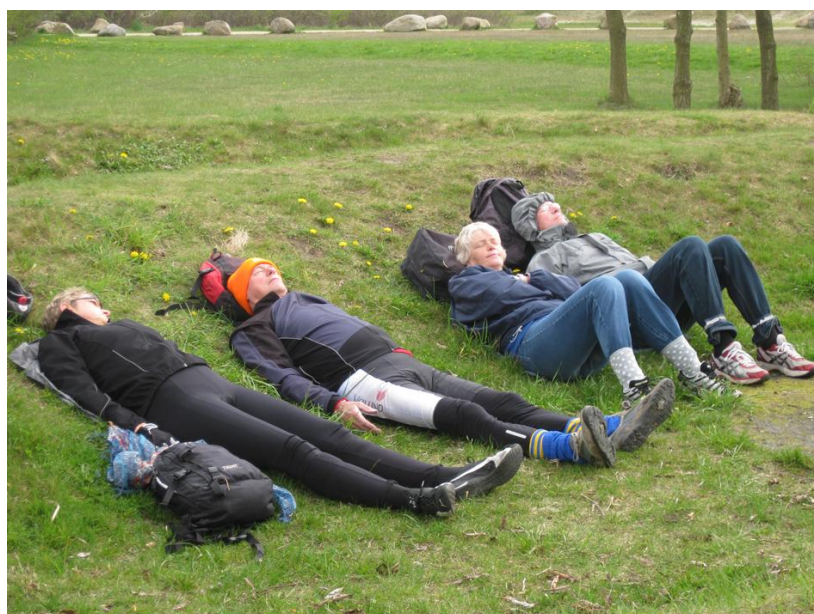
Hvor kan man føle sig lille !!