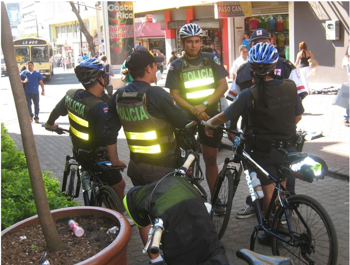
Cyklende politi i San José, Costa Rica.