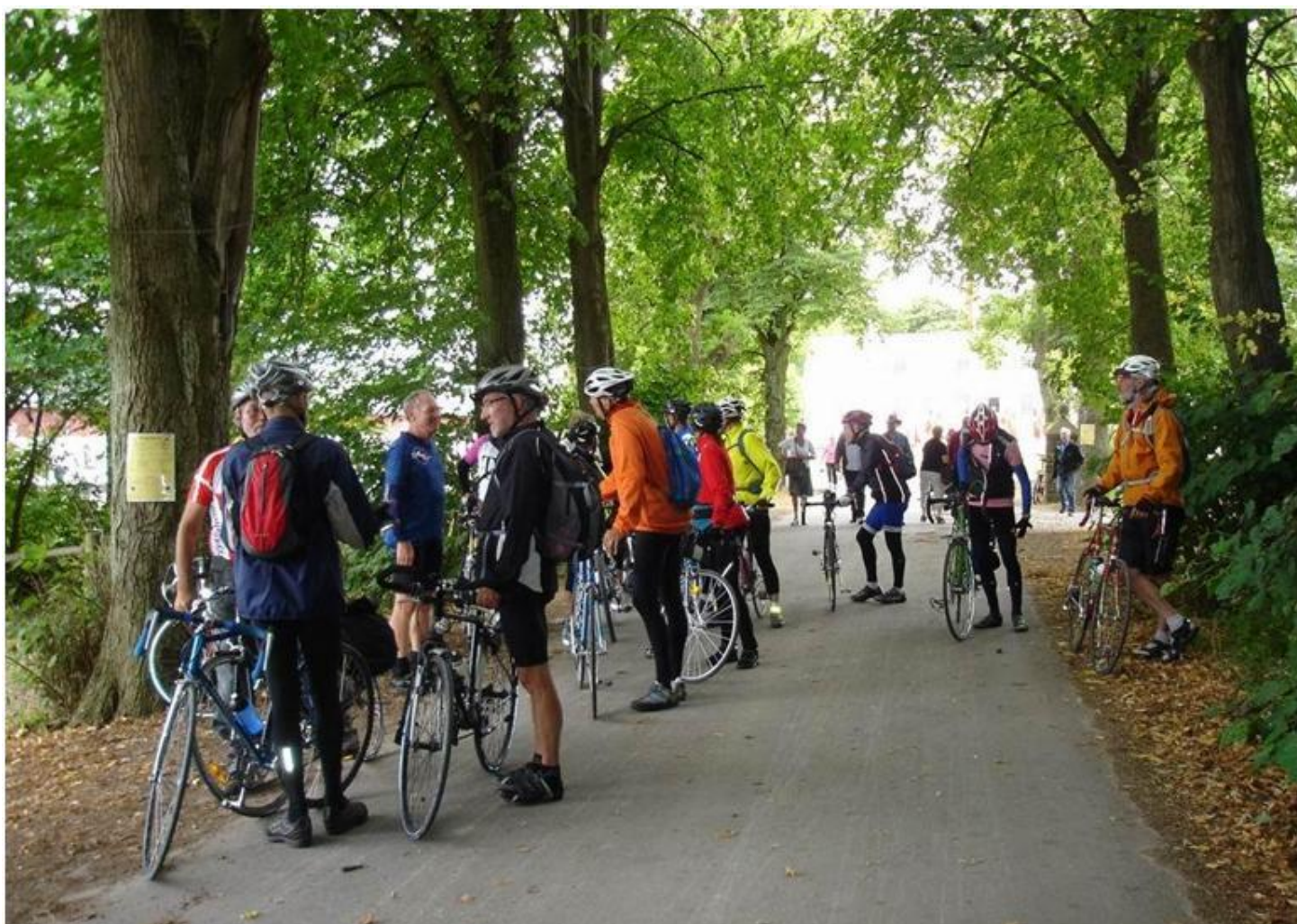
Pause på turen til Nyvang