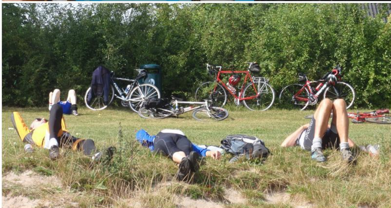
Ih! Hvor kan man blive træt på en cykeltur