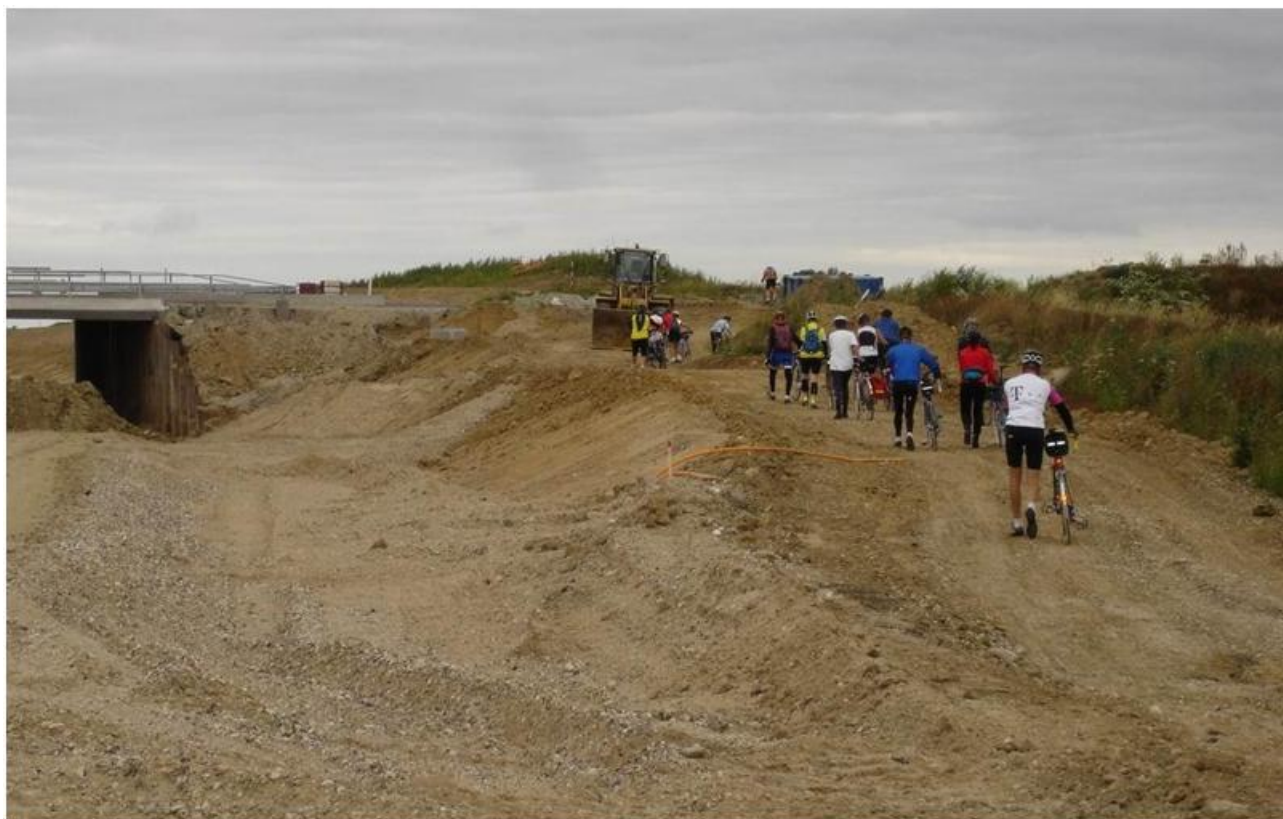
Hvem mon har arrangeret denne tur?