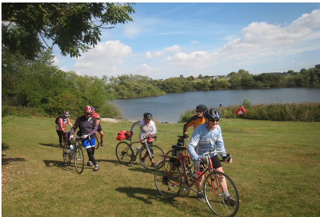
Gå ud og gå en cykeltur