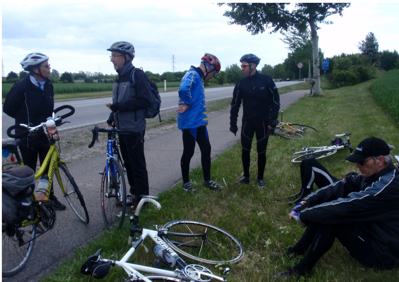
Pause på vejen til Kjøge Mini-By.