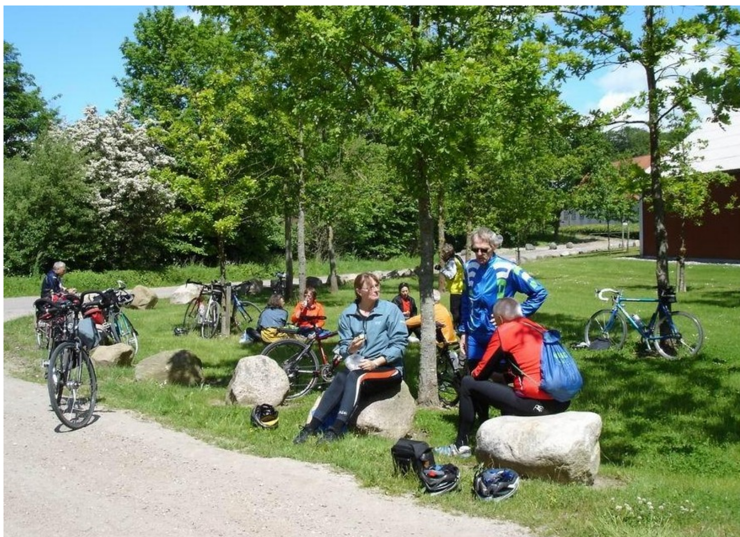
Kalundborgturen – frokost i det grønne.