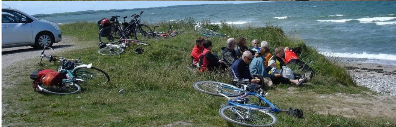
Kalundborgturen til fods, på cykel og siddende.