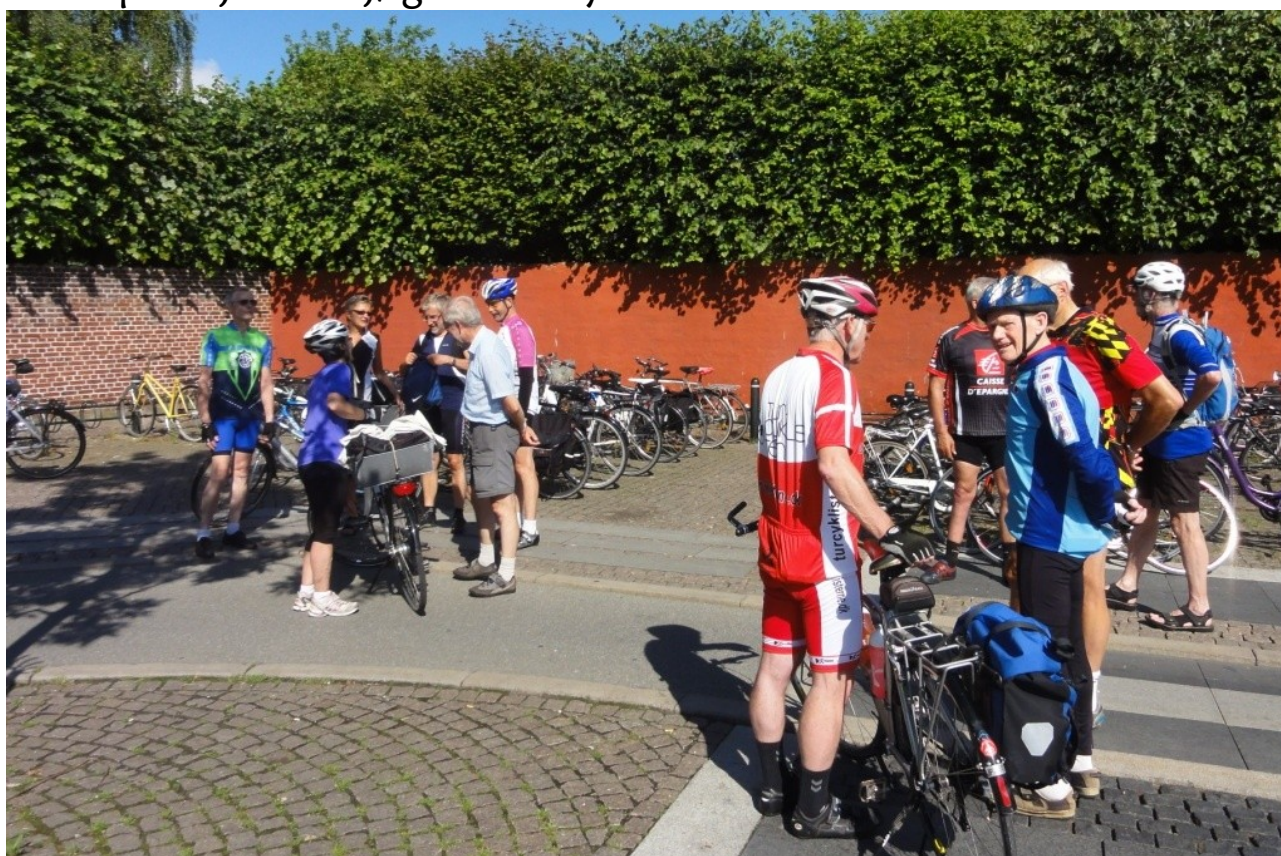
Mødestedet på Haraldsted Sø turen.