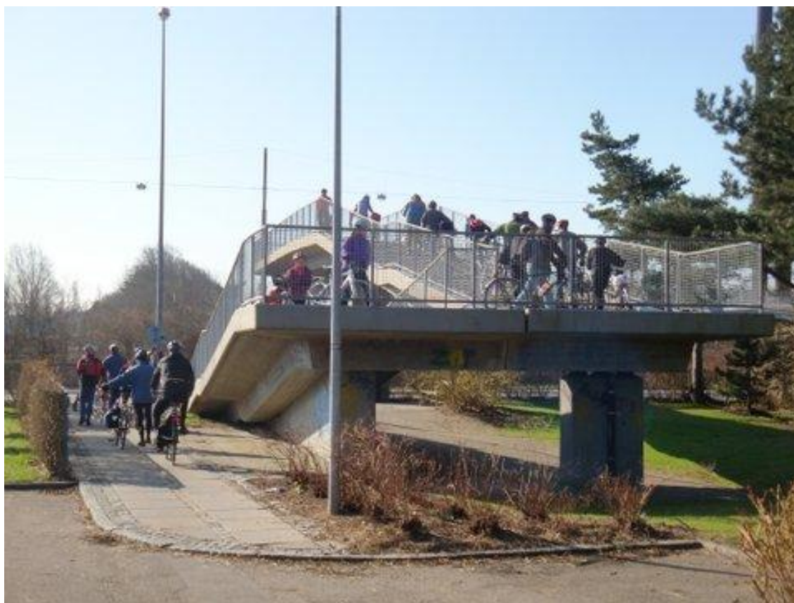
Åbningstur med udfordringer