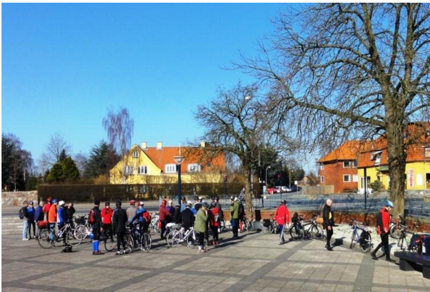
Åbningstur i høj sol