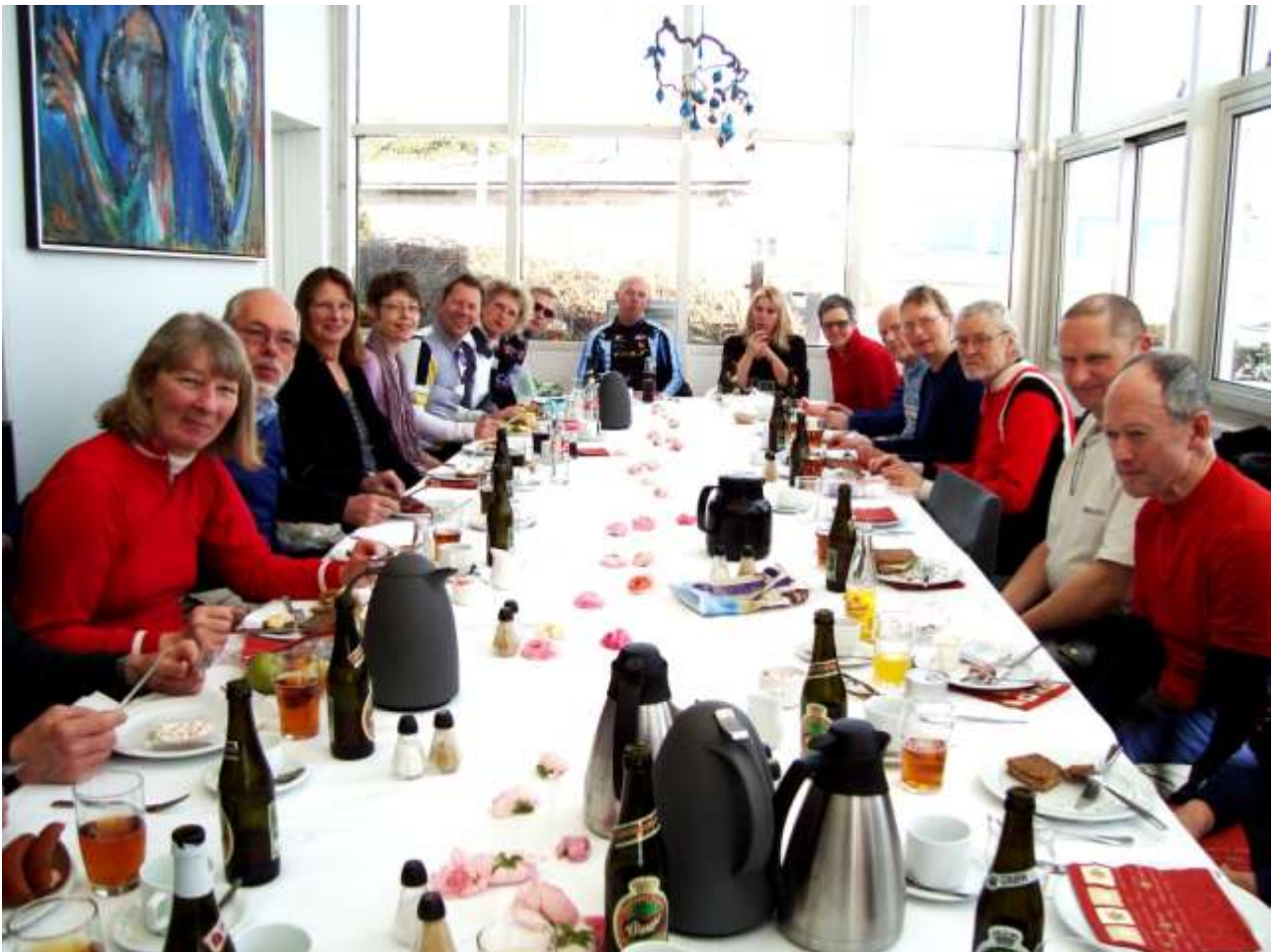
Frokost på Tårnbæk Kro – fra åbningsturen 27. marts

Deadline for næste Turcyklisten: 15. august 2011