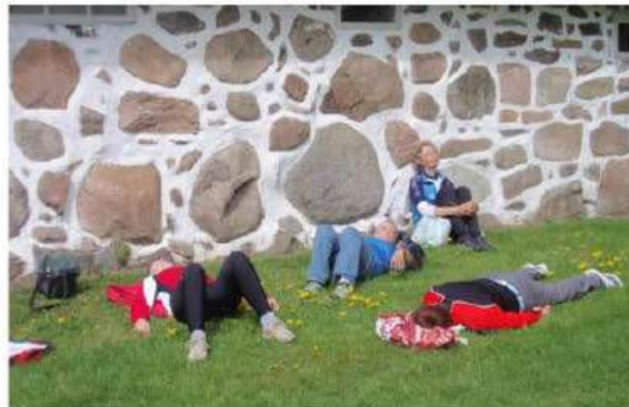
Totalafslapning efter traveturen.