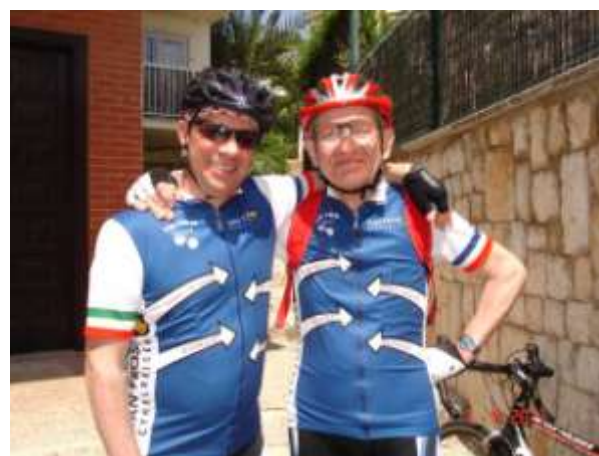
Mallorca 1. - 8. maj