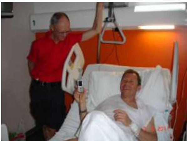
Brækket lårben på Mallorca (2. maj)