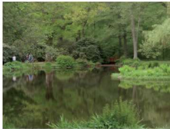
Malerisk foto fra Krapperup.