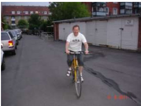
Op på cyklen igen (6. juni)!