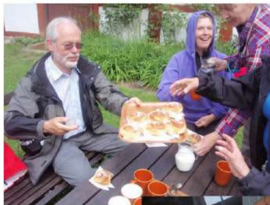
Så er der kanelbullar