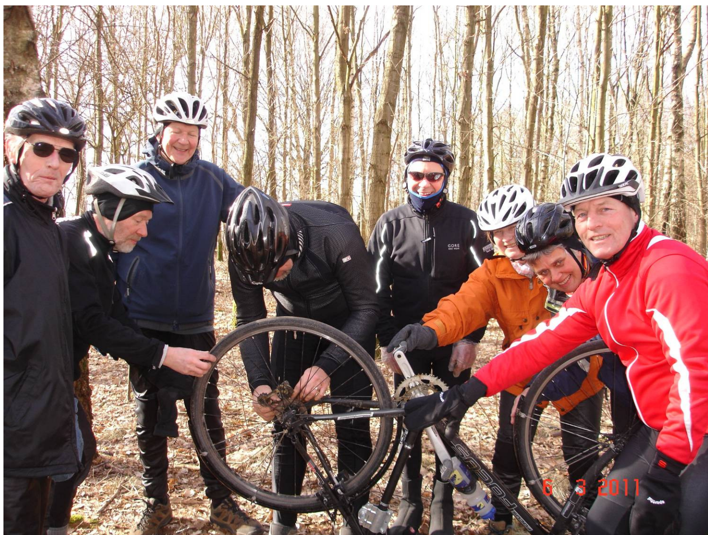
Vintertræning – med defekt