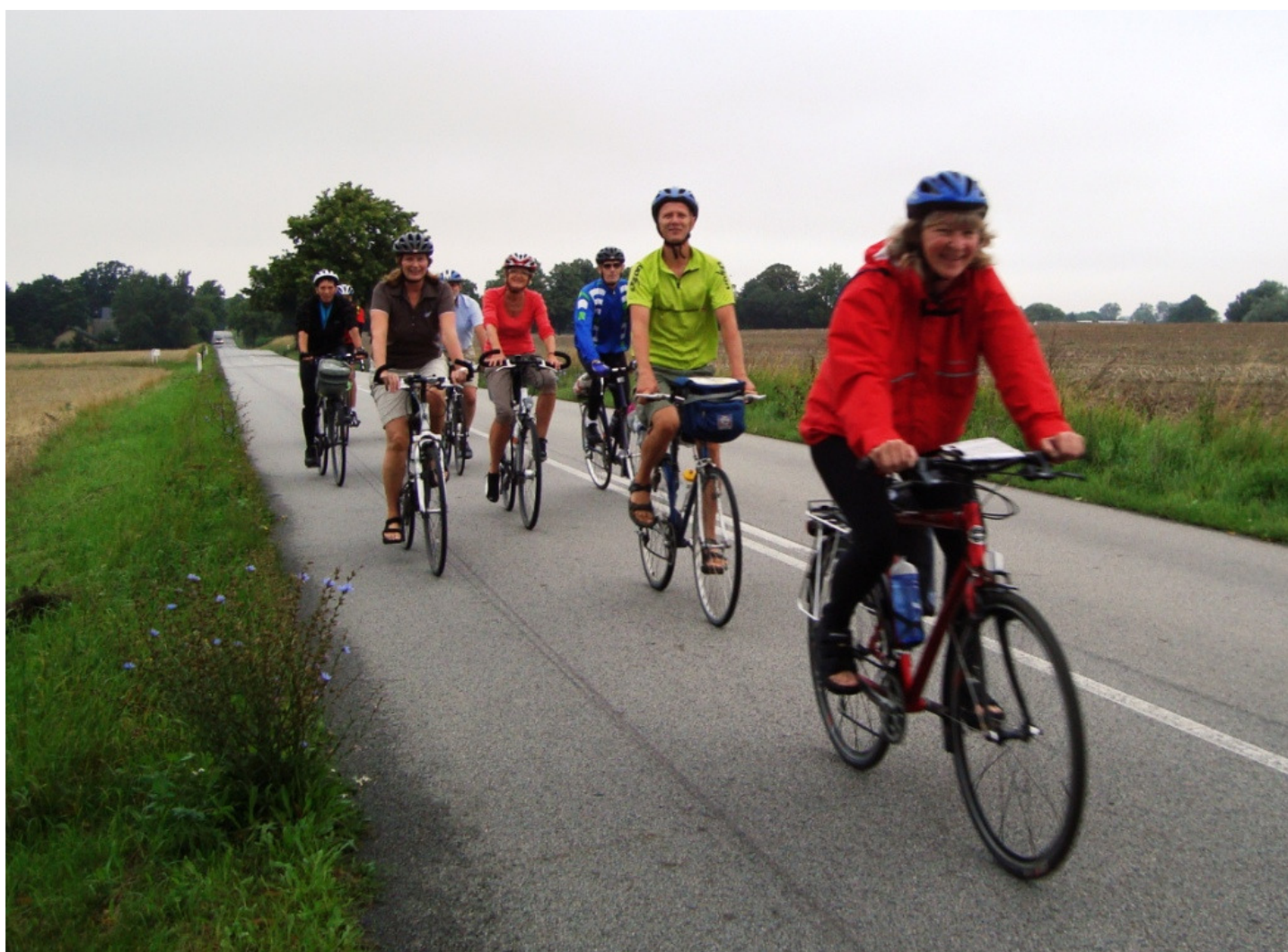
Turen til Stevnsfortet