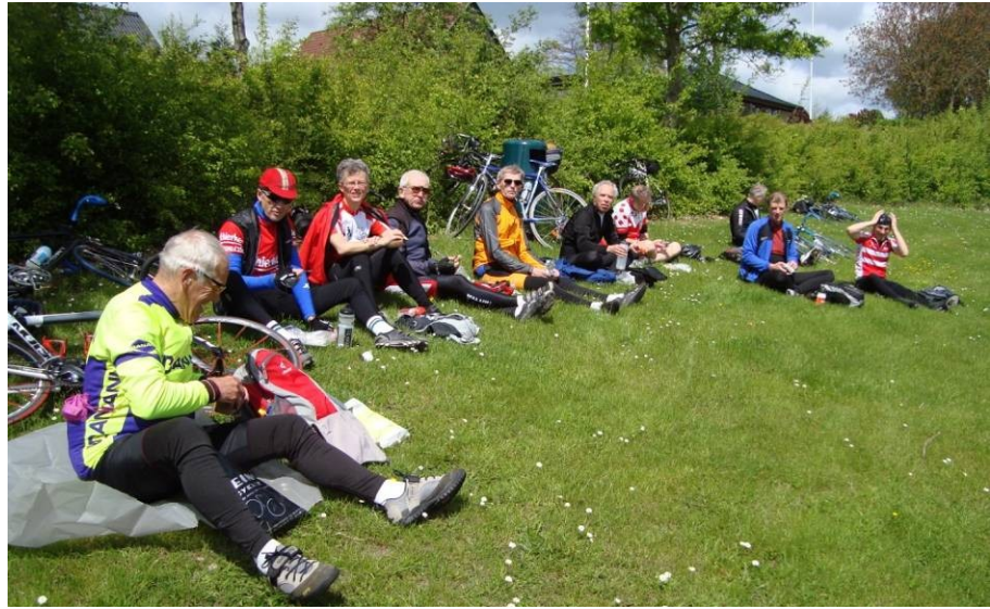
Onsdagstræning Risby, før og efter spurten: