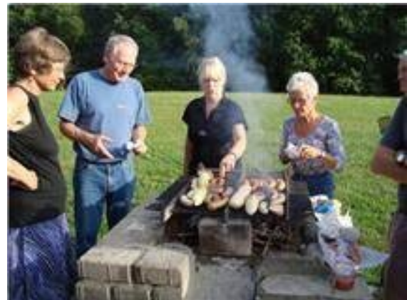
Grillaftenerne fik en fin sæson

Annoncøren beder om at medlemmer ved køb gør opmærksom på medlemskabet.