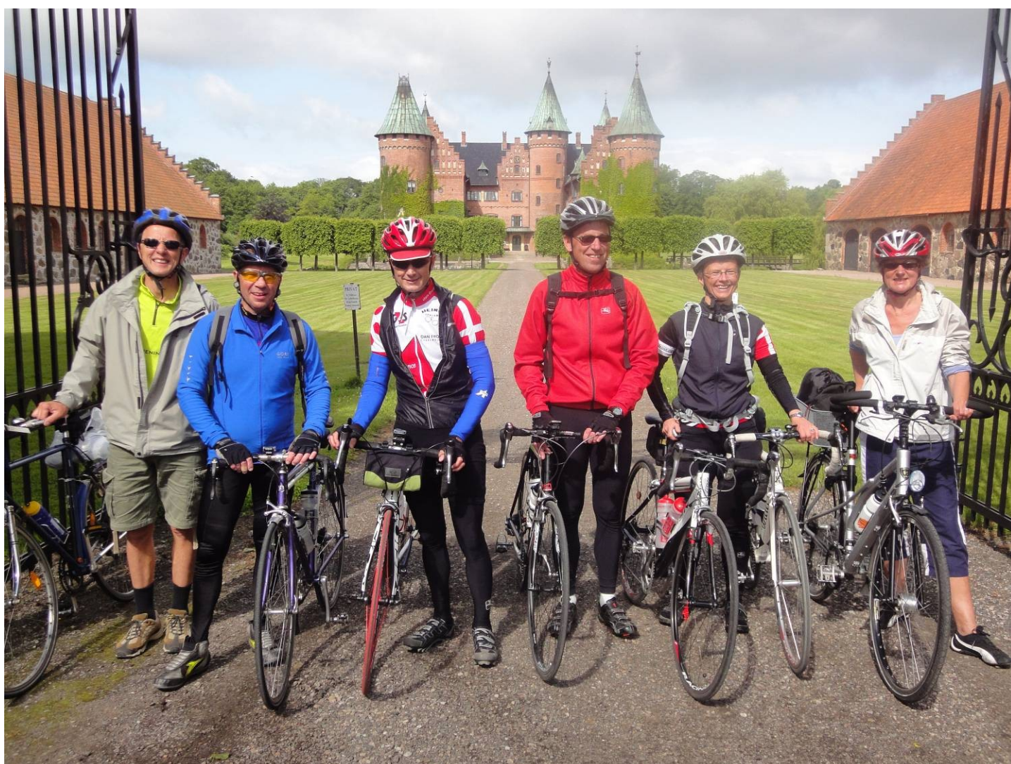
Ringsjön-turen, med Trolldenäs-slottet i baggrunden