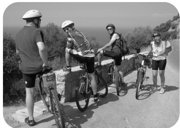
Udsigt på Korsika

Den løsning var der også to turcyklister som måtte vælge det år hvor de som følge af udmattelse valgte at opgive med adskillige hundrede km til Oslo.