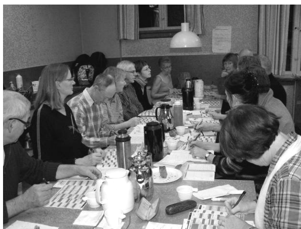
Hvor går turene hen til næste år?