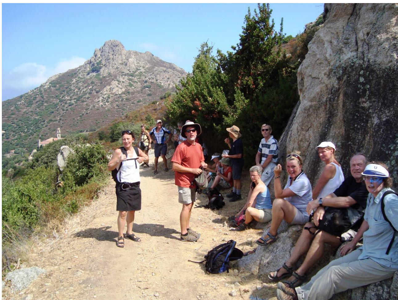
Cyklister på vandretur på Korsika august 2009

Deadline for Turcyklisten 1 2010 er 18. januar.