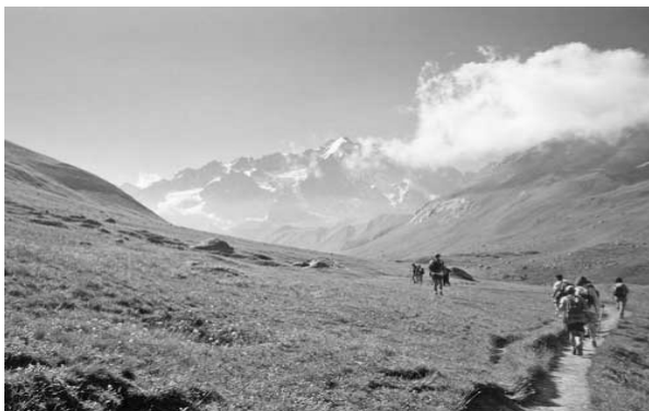
Vandretur i Valloire

Cykelleje: I Valloire kan lejes både racercykel og mountainbike i god kvalitet. Pris for racercykel ca. 30 euro/dag, og mountainbike ca. 12-14 euro/dag. Rabat forventes ved leje på ugebasis.