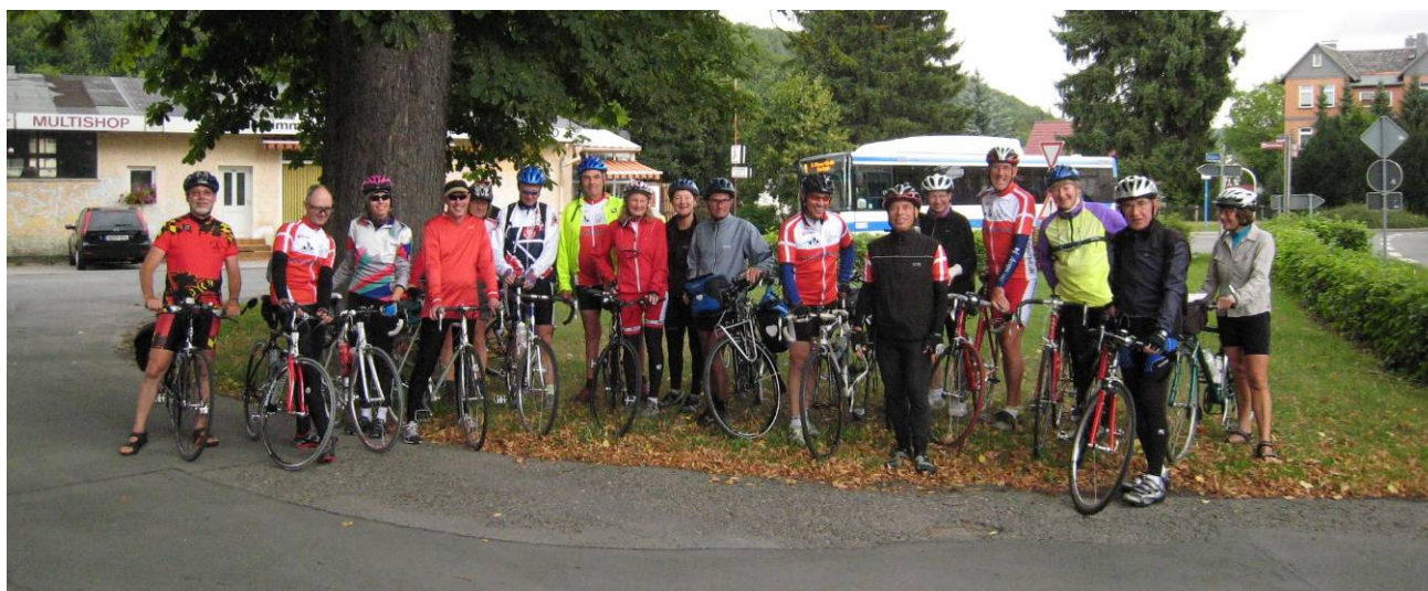
24 Turcyklister tog til Harzen i august, her er næsten hele holdet.