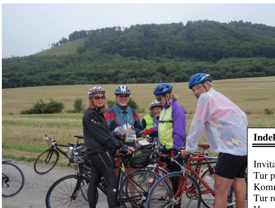
Kortet studeres.