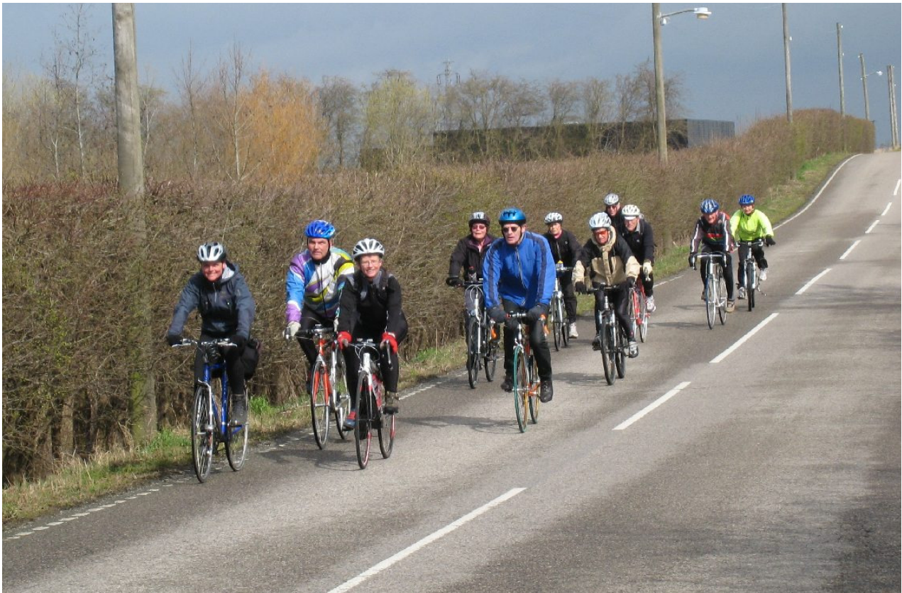
Optimist tur