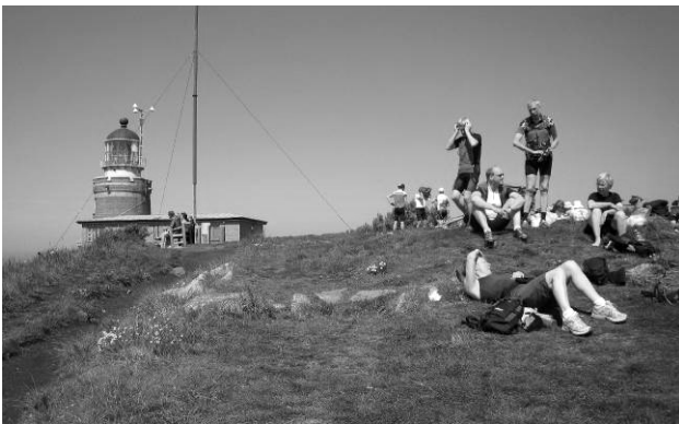
Afslapning på Kullen