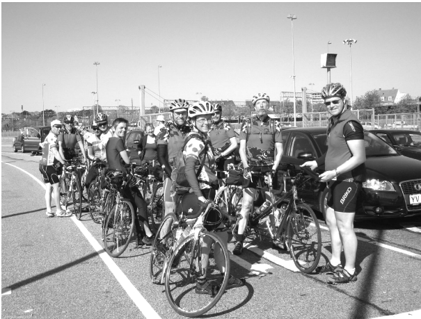
Der ventes på færgen til Helsingborg