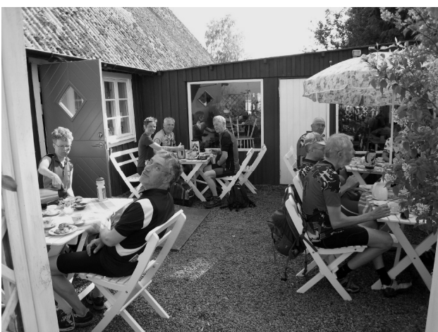
Kaffe og kage