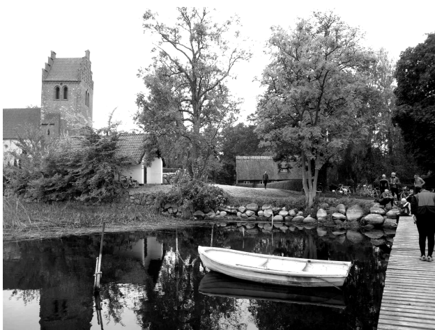
Mosehus turen