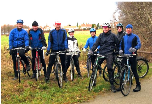
Vintertræning november 2007