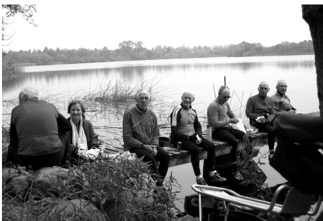
Mosehus turen