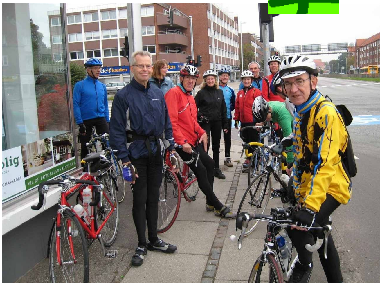
Forventningsfulde Turcyklister før Mosehus turen