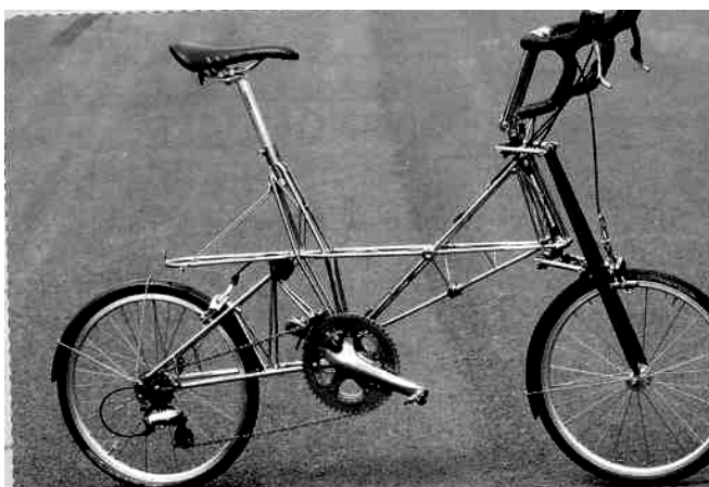
Moulton Twin Pylon