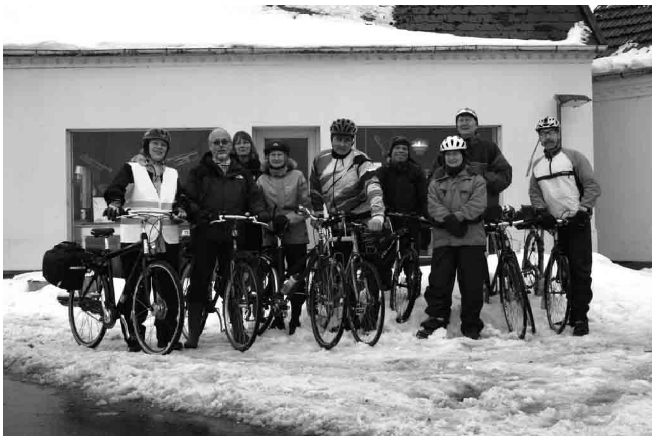
Endelig fremme i Herringløse