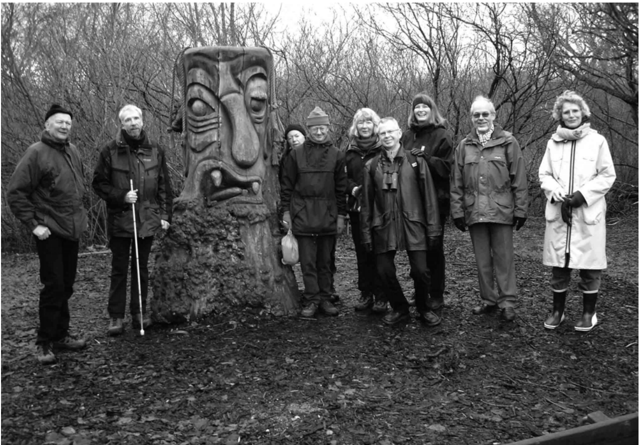
Vandretur før nytårsfrokosten