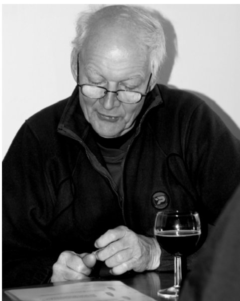
Ølmenuen studeres af turlederen