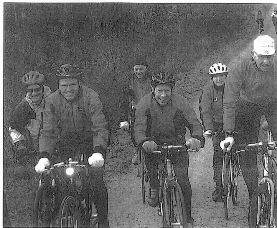
En flok friske turcyklister på vintertr ning