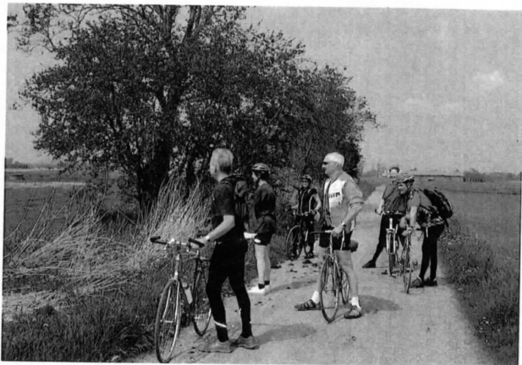
På bunden af Søborg Sø (tørlagt)

Det sidste stykke efter Søborg Sø mod Gilleleje gik ad den rigtig gode og asfalterede cykelrute og lige ned til havnen. Da denne mindede om en blanding af Dyrehavsbakken og Skagen Havn blev vi ret hurtigt enige om at nøjes med at købe ind her og finde et mere fredfyldt sted ved vandet til frokosten. Solen bagte, vandet blinkede for fodenden og nogle prøvede at snubbe en lille lur, men der var ingen kære mor, turlederen svingede pisken, tiden var knap og nu skulle der arbejdes frem mod det vanlige turcyklist højdepunkt kaffe / kage. Et skue ud over havet mod Kullen fik vi ved Fyrkroen inden vi ad hyggelige småveje igennem Snævret Skov ad en meget smuk sti (her havde vi vist aldrig været før) blev ført lige ind igennem Esrum Kloster.