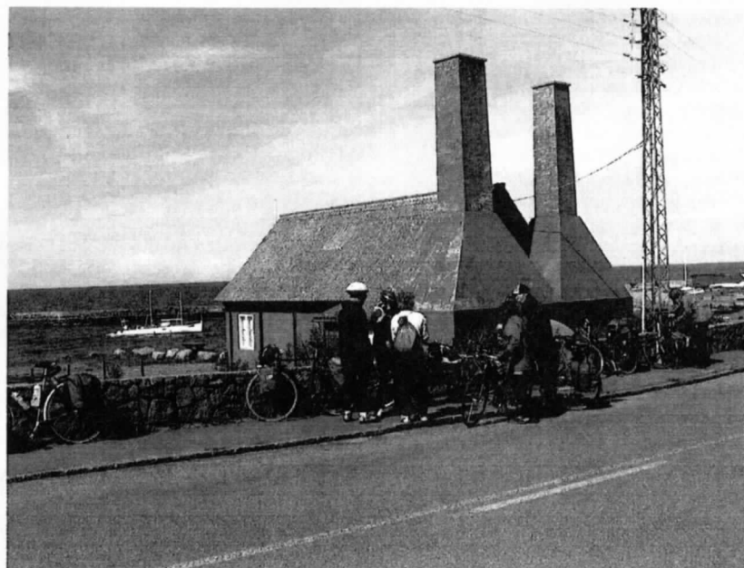
Jubilæumsturen Bornholmsk Røgeri